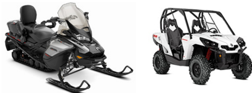
Ski-Doo Grand-Touring 600 E-TEC Buggy des neiges