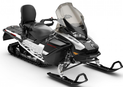
Motoneige biplace 900cc ACE