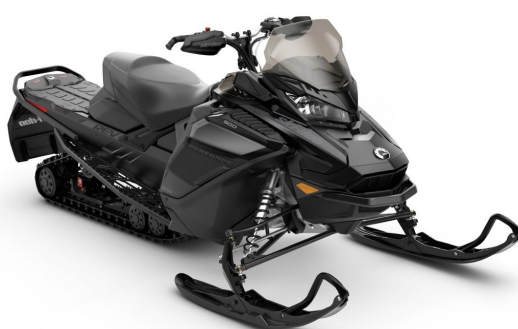
Motoneige monoplace 900cc ACE en extra