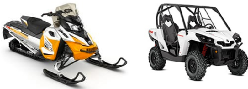
Ski-Doo Renegade 600 ACE Buggy des neiges