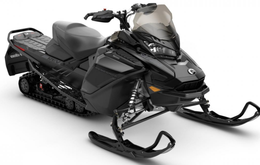
Motoneige monoplace 900cc ACE en extra