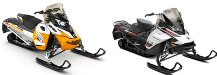
Ski-Doo Renegade 600 ACE Ski-Doo Renegade 900 ACE en extra