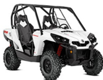
Buggy des neiges