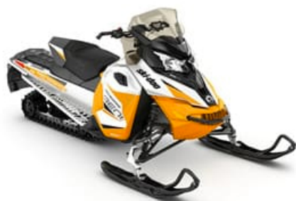
Ski-Doo Renegade 600 ACE