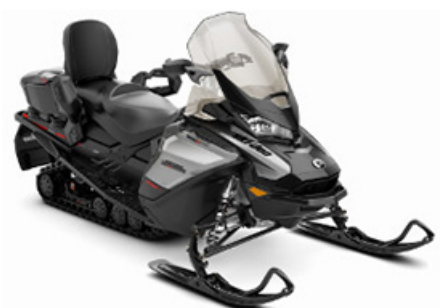
Ski-Doo Grand-Touring 600 E-TEC