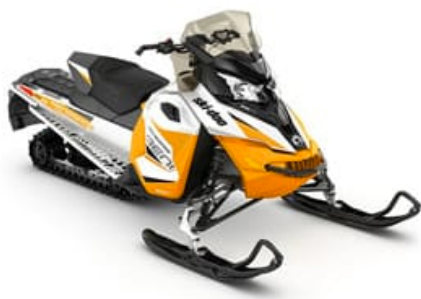
Ski-Doo Renegade 600 ACE