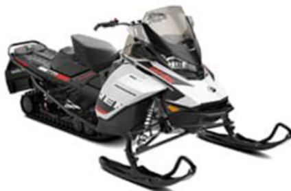
Ski-Doo Renegade 900 ACE en extra